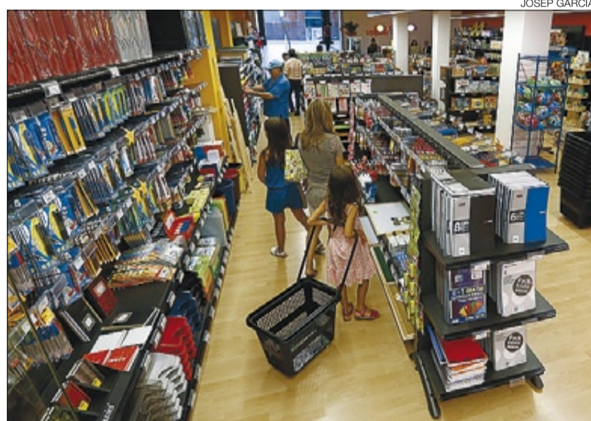
► Surtido ► Interior del establecimiento Uppali de Ripollet.

La nueva línea de negocio está prevista en el plan estratégico 2013-2015 de la cooperativa. Según la firma, los nuevos establecimientos se centran en «ofrecer a los clientes productos de papelería, manualidades, juguetes y libros infantiles, cuatro líneas de negocio que han mostrado un buen comportamiento de las ventas en los últimos ejercicios». «Uppali se desarrolla en locales de una superficie no inferior a los 150 metros cuadrados, en el eje comercial de las poblaciones», añade Rodríguez, quien asegura